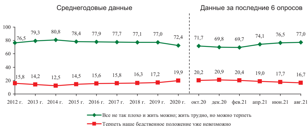
Рис. 25. Динамика показателя запаса терпения (в % от числа опрошенных)*