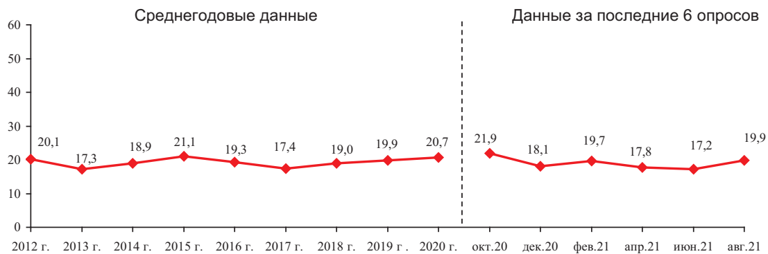
Рис. 26. Динамика потенциала протеста (в % от числа опрошенных)*

* Потенциал протеста – доля респондентов, ответивших на вопрос «Что Вы готовы предпринять в защиту своих интересов?» следующим образом: «Выйду на митинг, демонстрацию»; «Буду участвовать в забастовках, акциях протеста»; «Если надо, возьму оружие, выйду на баррикады».