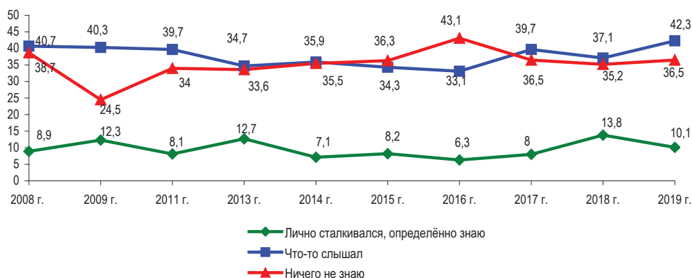
Рис. 47. Знаете ли Вы о деятельности в Вологодской области некоммерческих (общественных) организаций (регионального отделения партий, профсоюзов, религиозных, правозащитных, благотворительных организаций, обществ и т.д.)? (в % от числа опрошенных)*